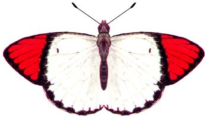
属名 Colotis 種小名 danae 英名 Scarlet Tip 和名 ダナエツマアカシロチョウ 分布 Tropical Africa 開長 59mm ♂