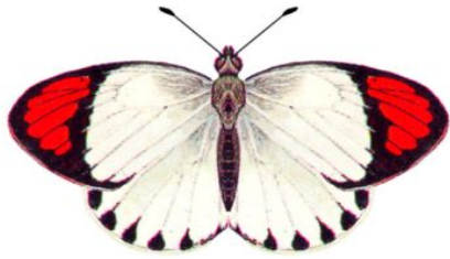
属名 Colotis 種小名 euppe 英名 Black Banded Red Tip 和名 エウイッベツマアカシロチョウ 分布 Tropical Africa 開長 59mm ♂