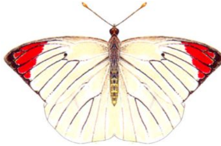
属名 Colotis 種小名 hetaera 英名 Crimson Tip 和名 ヘタエラツマアカシロチョウ 分布 East Africa ~ Ethiopia 開長 65mm ♂