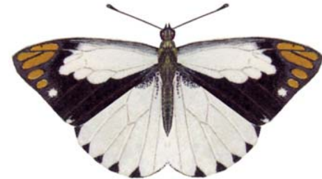
属名 Colotis 種小名 eris 英名 Black-Barred Goldtip 和名 クロオビキンツマアカシロチョウ 分布 All Africa, Arab 開長 60mm ♂ 食草 フウチョウボク科

本属は、アフリカを中心として分布。筆者はサウジアラビアで一種採集。前翅の先端に種によって異なる各種の色の装飾斑がある。乾季と雨季で形体が異なる。