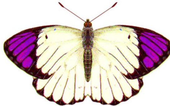
属名 Colotis Colotis_regina 種小名 regina 英名 Large Violet Tip 和名 レギナツマアカシロチョウ 分布 Kenya ~ Mozambique 開長 80mm ♂